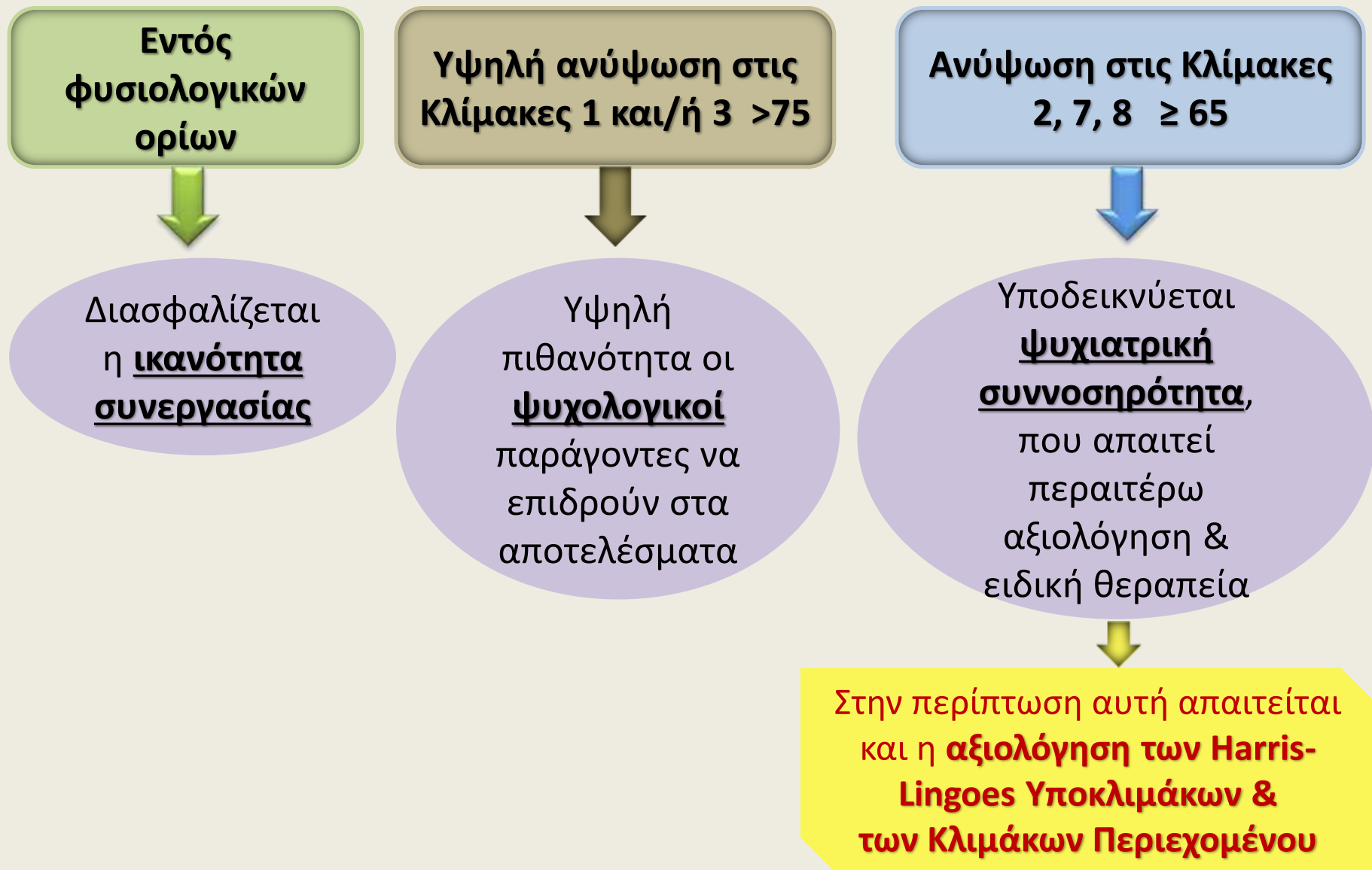
Διάγραμμα 2. Ερμηνεία των Κλινικών Κλιμάκων του ΜΜΡΙ-2 σε Νοσοκομειακά Περιβάλλοντα